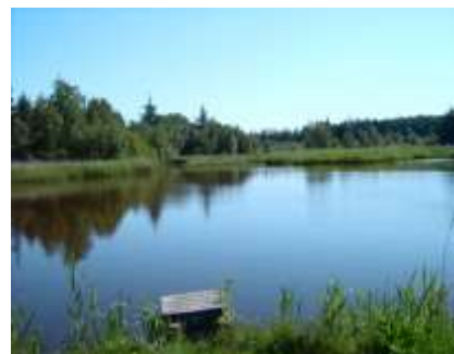
See in der Langenhorner Heide