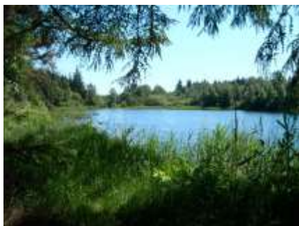
See in der Bordelumer Heide

Zu beiden Seiten der Bundesstraße 5 erstrecken sich vom Stollberg aus zwei Naturschutzgebiete mit vielen Wanderwegen, vorbei an idyllischen Seen. Nördlich geht der oben erwähnte Naturerlebnisraum direkt in die Langenhorner Heide über. Westlich des Stollbergs liegt zwischen der B 5 und der Bahnlinie zunächst ein kleines Waldgebiet und hinter der Bahnlinie dann die Bordelumer Heide .